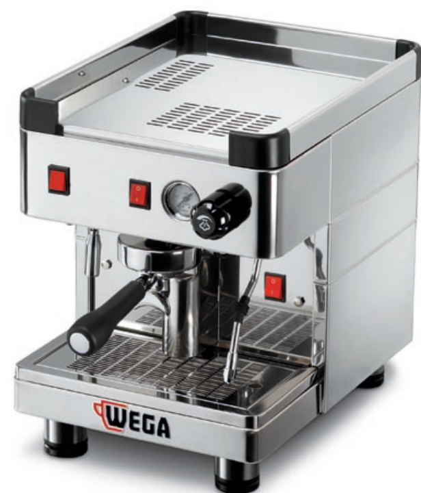
Modello MININOVA STANDARD versione EPU