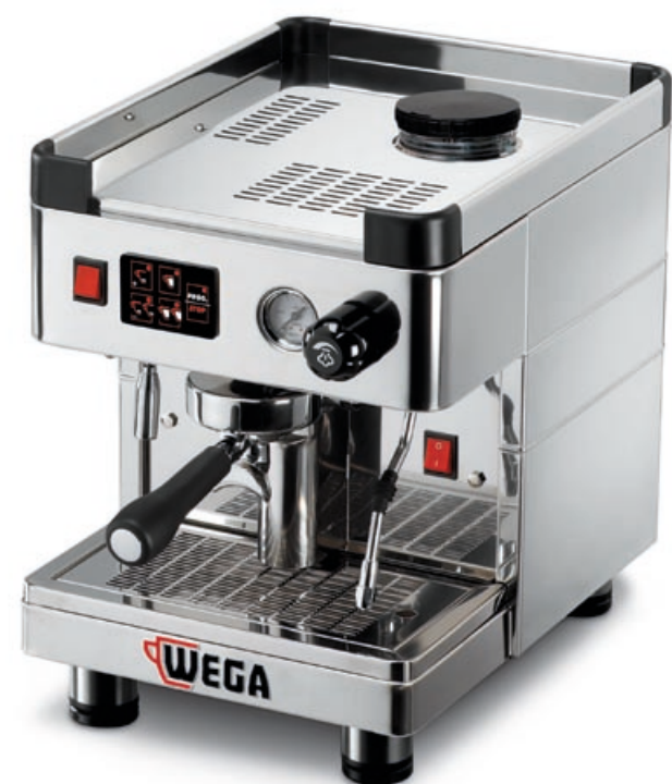
Modello MININOVA STANDARD versione EVD