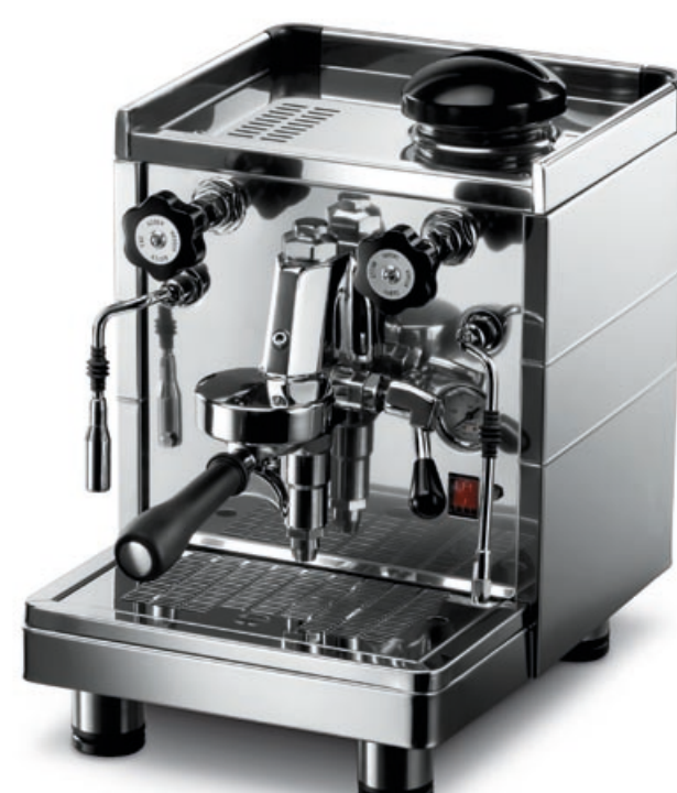
Modello MININOVA CLASSIC versione EMA